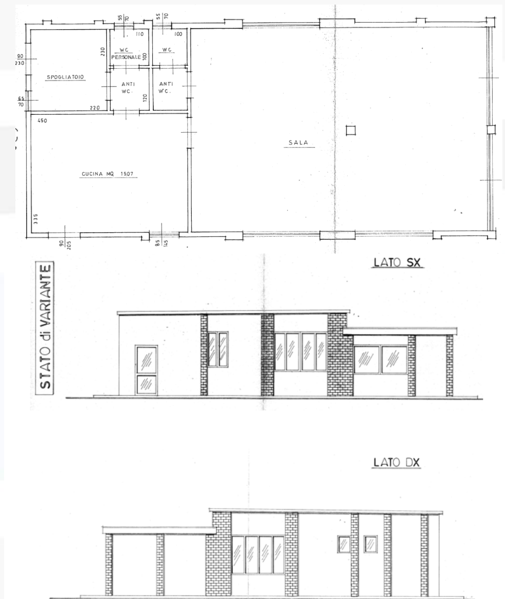
Fig. 10 – Foto interno: sala, cucina, spogliatoio, viste esterne