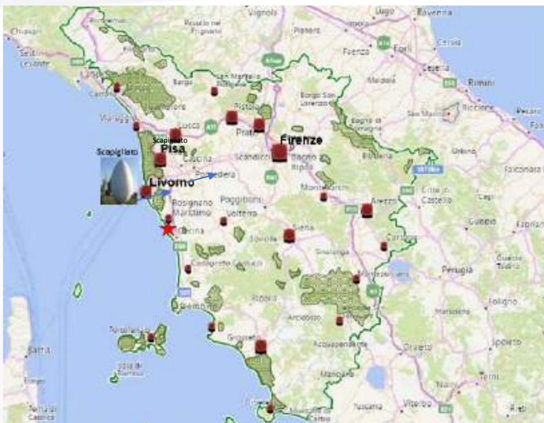
Fig.1 – Inquadramento a livello regionale

Il fabbricato di cui alle presenti linee guida è ubicato nel Comune di Rosignano Marittimo in provincia di Livorno, quest'ultima città costiera della Toscana bagnata dal Mar Tirreno, uno dei più importanti porti italiani, sia come scalo commerciale che turistico con diverse testimonianze storiche, artistiche e architettoniche. La città di Livorno, notevolmente sviluppatasi dalla seconda metà del XVI secolo per volontà dei Medici prima e dei Lorena dopo, fu importante porto franco frequentato da numerosi mercanti stranieri. Tra il XIX secolo e i primi anni del Novecento, parallelamente all'avvio del processo di industrializzazione, fu mèta turistica di rilevanza internazionale per la presenza di rinomati