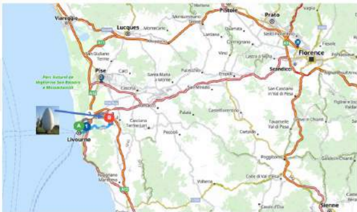
Fig. 2 - Inquadramento infrastrutture

Il fabbricato è sito nel Comune di Rosignano Marittimo in Località Scapigliato lungo la SR206 presso il Km 16, tale fabbricato è caratterizzato dalla presenza di un “uovo” gigante che doveva essere l’insegna di una fattoria e prima ancora l’indicazione dell’allevamento di uova, rimasto come riferimento e caratterizzazione molto nota di tale area.