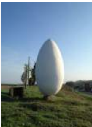
Fig.3 – Caratteristica dell’area

Dista circa 7,5 Km dall’abitato di Rosignano Marittimo, 21,6 km da Livorno e circa 106 km dal capoluogo toscano, connesso con la rete infrastrutturale come segue: